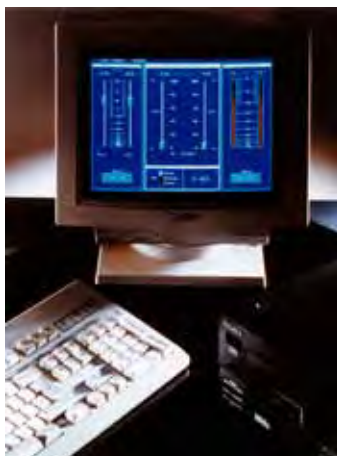
1990 年第一款 CEDAR system

这也在很大程度上吸引了那些守旧的人群，他们在这项技术出现之时拒绝去接受它。“我们曾被告知实时音频修复是不可能的——不是困难而是不可能，”Reid 先生说道，他回忆起某一年的 AES 展会，曾有一