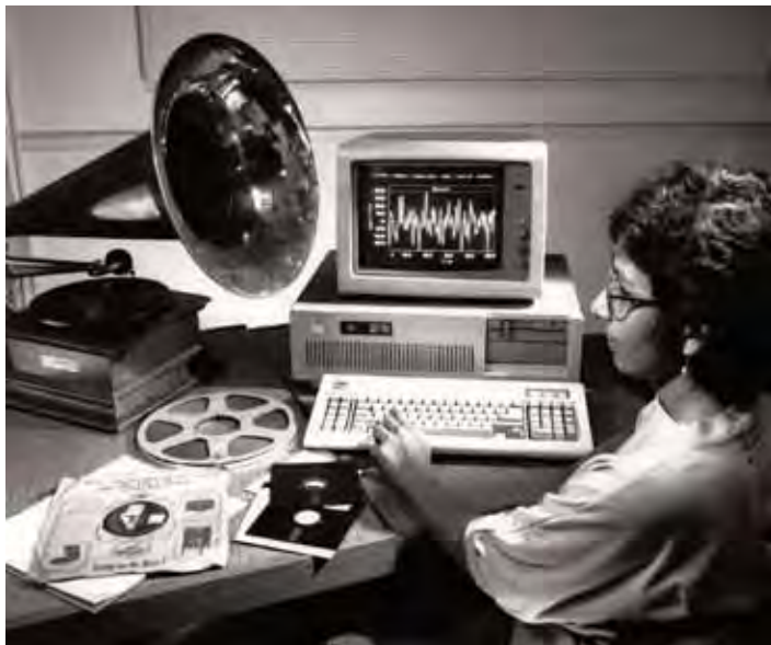
1988 年 CEDAR 系统原型

所大学联系在一起, 但却有一颗音乐家的心”。他还补充说道: “这里可没有那些不讲情面的商人。”