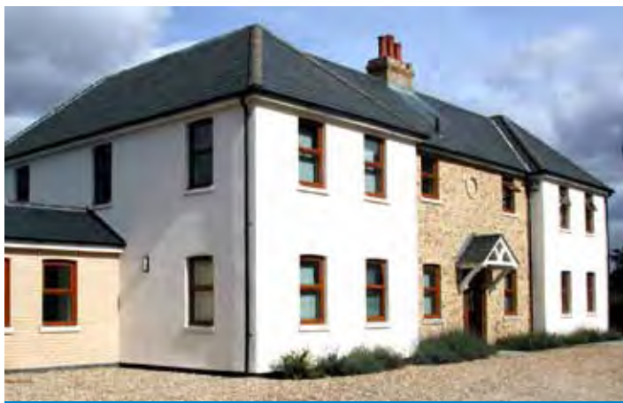
位于英国剑桥的 CEDAR 总部外景