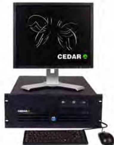
最新的 CEDAR Cambridge V8